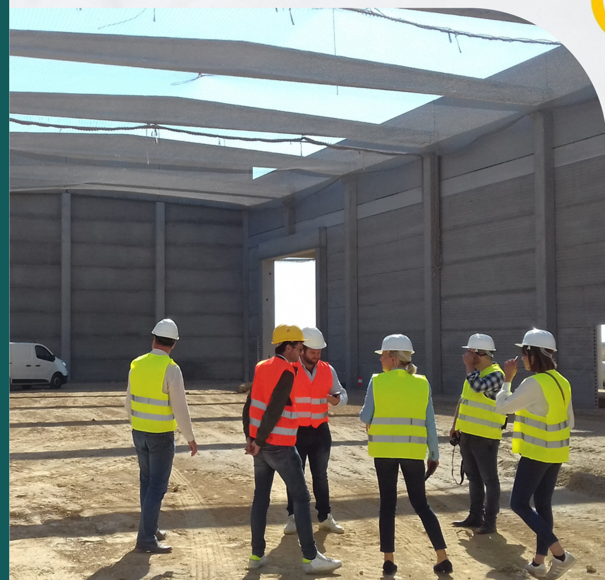
Projet de construction d'une usine de teillage de lin à Saussay-la-Campagne