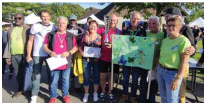
L'équipe de Gamaches-en-Vexin, gagnante des défis intellectuels et sportifs.