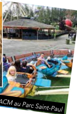
L'ACM au Parc Saint-Paul