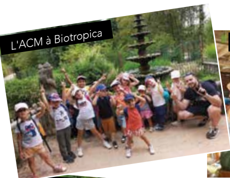
L'ACM à Biotropica