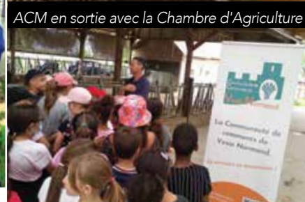
ACM en sortie avec la Chambre d'Agriculture