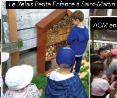
Le Relais Petite Enfance à Saint-Martin