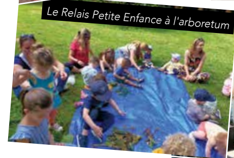
Le Relais Petite Enfance à l'arboretum