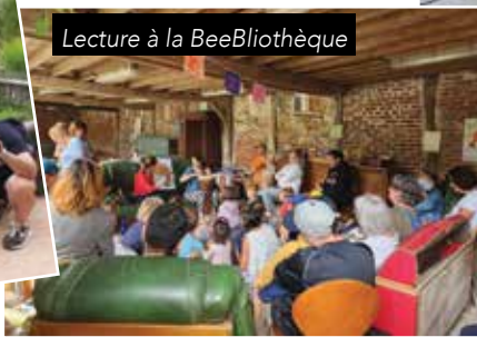
Lecture à la BeeBliothèque