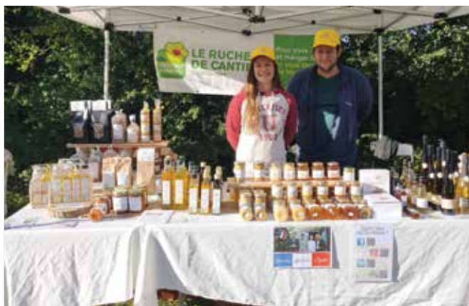
Les visiteurs et les participants ont pu découvrir les produits de producteurs locaux.