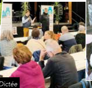
La Grande Dictée