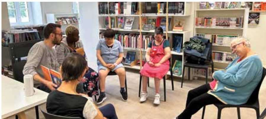
Les séances de lecture : un moment de partage et de sérénité pour les résidents de la Maison d'Accueil spécialisée.