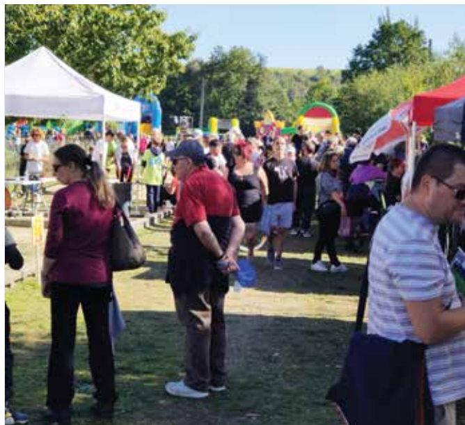
La Fête de la Voie Verte est co-organisée par le Syndicat Mixte de la Voie Verte de la Vallée de l'Epte et la CC Vexin Normand.