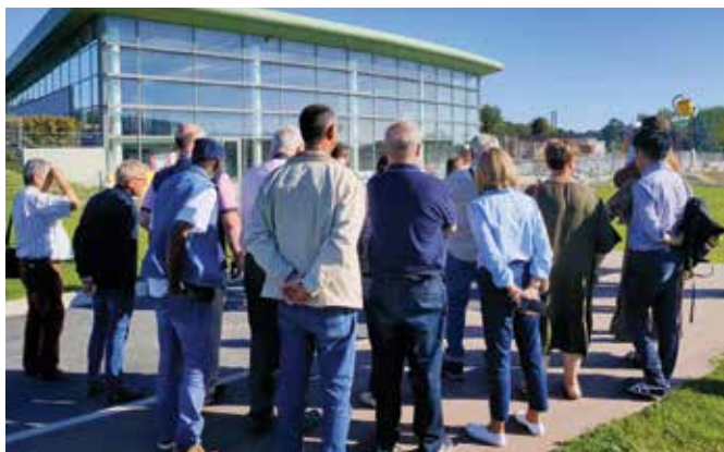
Cette première édition de " l'Élus Tour " a été très appréciée des participants. Ici, au complexe aquatique Aquavexin.