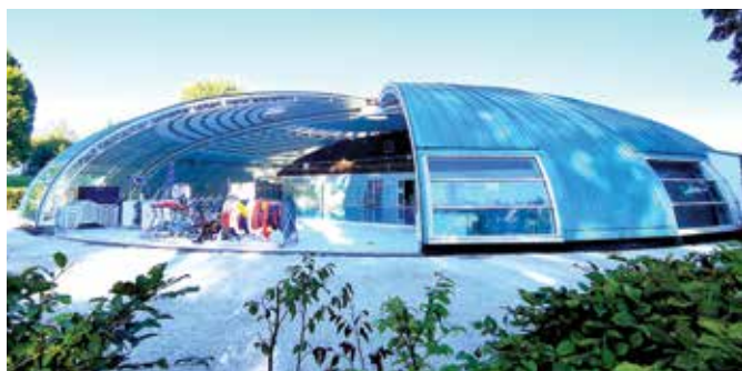
La piscine Tournesol à Étrépagny